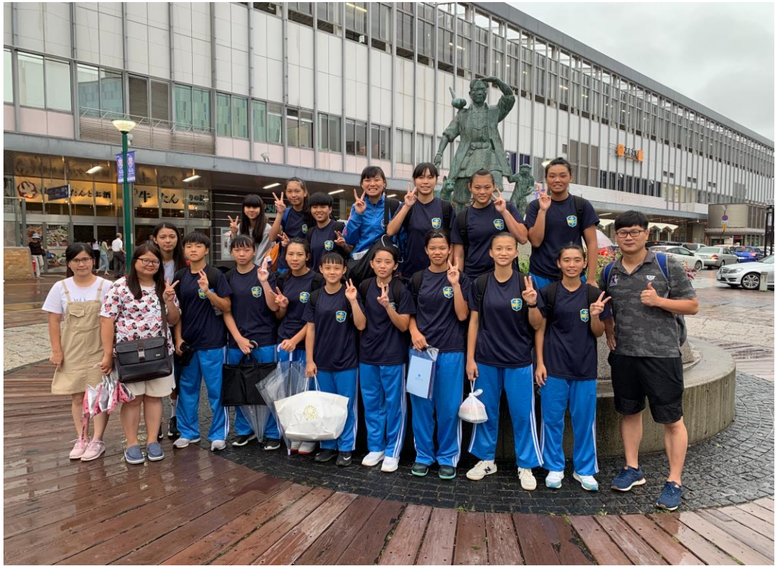
108 學年度日本岡山移地訓練 ↓