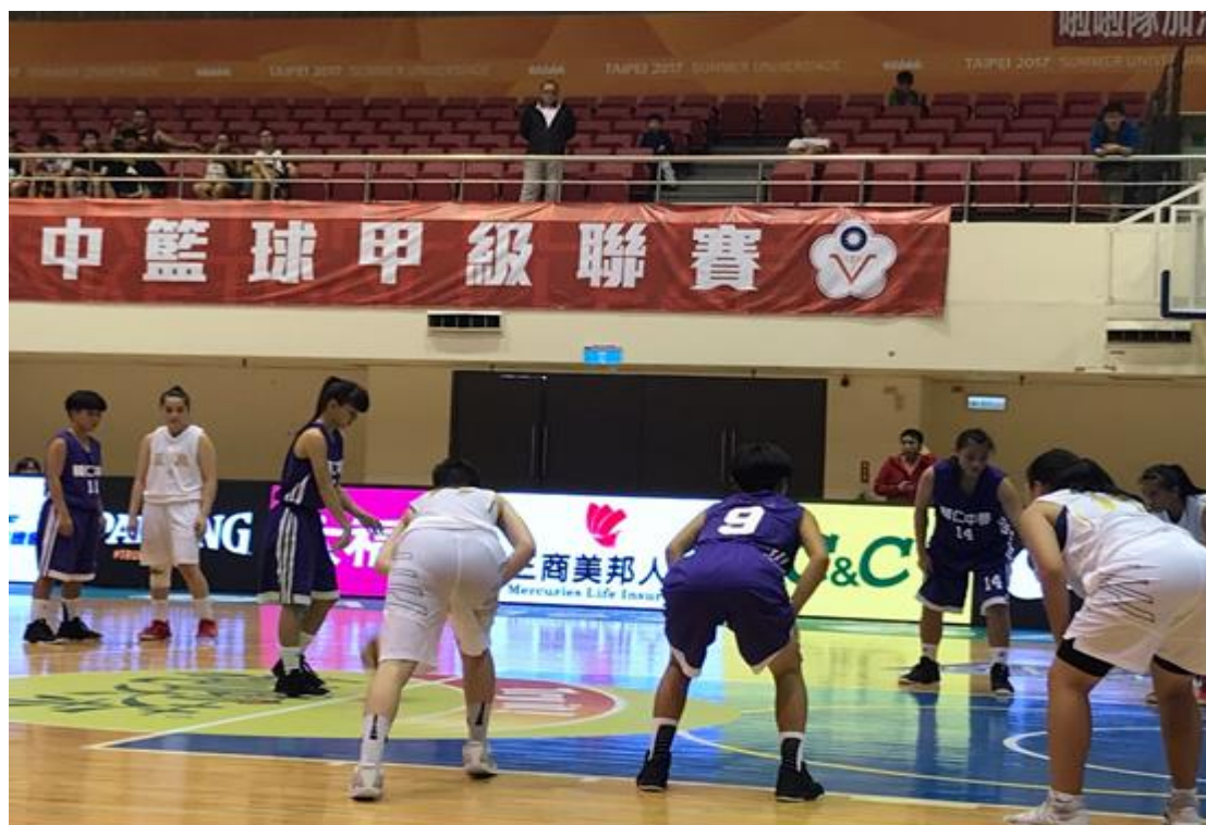
108 學年度高中甲級聯賽比賽照片↓