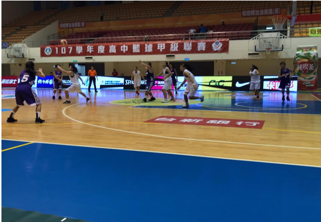
107 學年度高中甲級聯賽比賽照片 ↓