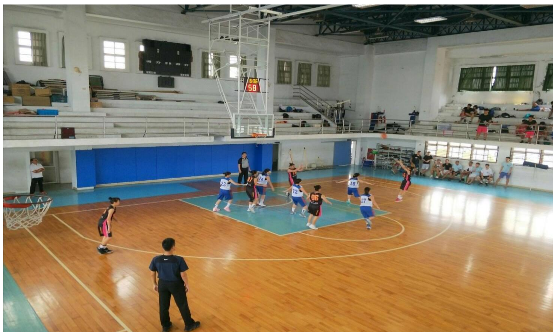
107 學年度高中甲級聯賽比賽照片↓