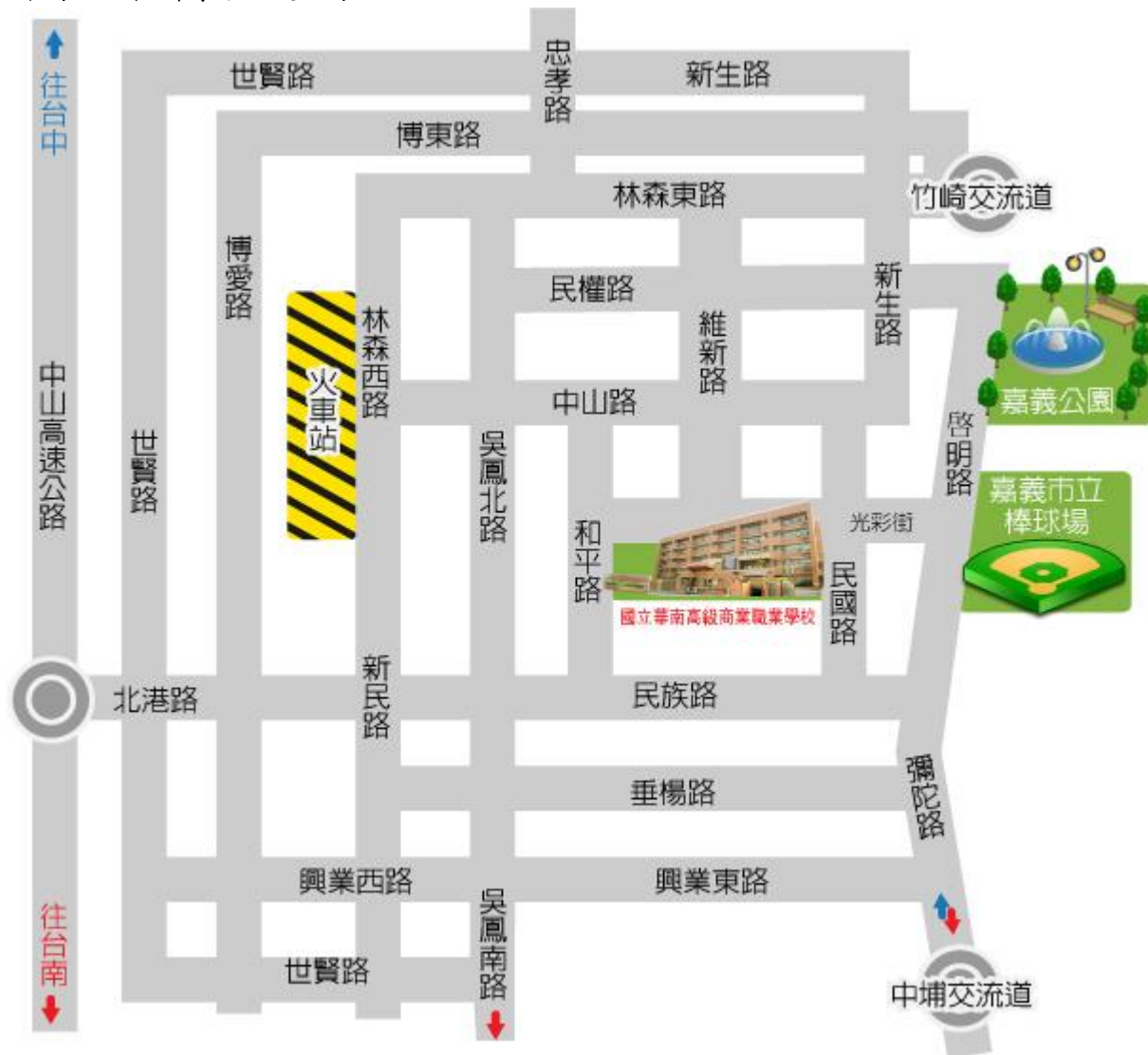
附圖一 承辦學校位置圖